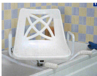
Siège pivotant baignoire